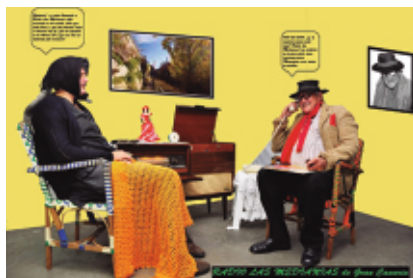
Radio las Medianías